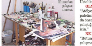
Elmacı'nın gelmişine mesekt.

"İkinci kişisel sergim, ekim sonunda Galeri x-ist'te açılacak. Onun öncesinde Basel'deki fuara katılacağım. 11 ay sonra Dubai'de üçüncü kişisel sergim olacak. 'Ateşinle Kuru Beni' serisinden eserlerim sergileyecek. 90'ların Türkiye'siyle bugünün Türkiye'si arasındaki siyasi ve toplumsal benzerlikler hakkında bir serisi resim bu."