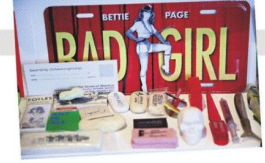
Batibek'i biriktirdiği küçük objelerin bir kısmını atölyesinde tutuyor.

"Ankara'nın m.1886 adlı yeni sanat mekânı, 3 Mayıs'ta, 'Catfight Tales' başlıklı sergimle açıldı. Bu serginin özelliği, üzerinde çalışmayı sürdürdüğüm, resim, fotoğraf, film ve yerleştirme gibi dört farklı disipline ait birer işimin yer aldığı bir sergi olması. 'Catfight Tales' adını taşıyan yeni video çalışmam, serginin ağır topu. 31 Mayıs'a kadar sürüyor."