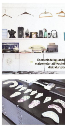
Eserlerinde kullandığı malzemeleri atölyesinde dizili duruyor.

gelen öğrencilerim oluyor. Diğer katta da daha çok resim yapıyorum." YENİ PROJELERİ NELER? "Sekiz-10 sergi açacak birikimim var şu anda ama bu sene bir sergi açmayacağım, öğrencilerimle meşgul oluyorum. İsk University Güzel Sanatlar Fakültesi'nde yetiştirdiğim öğrencilerimle Piramid Sanat'ta 'Sanat Sıcağı' başlıklı bir sergi açtık. Onlar için ilk adım. Ben de onlar kadar heyecanlıyım. Bir de Taksim'de Talimhane Tiyatrosu'nun yakınında bir bina aldım. Bir katında atölyeler, bir katında evim, bir katında da galeri olacak. Andy Warhol'un 'Fabrika'sı gibi olmasını istiyorum. Gizli kapaklı çalışmam istemiyorum artık. Zaten atölyem canlıdır, herkes gelip gider."