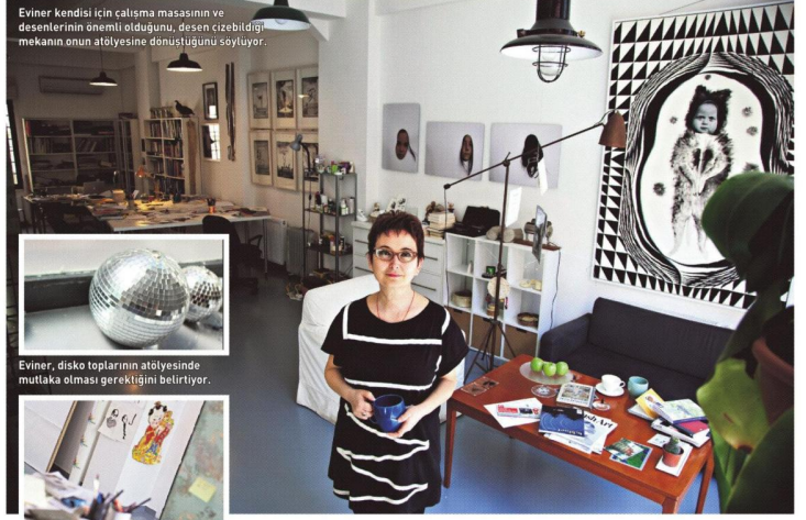
Eviner kendisi için çalışma masasının ve desantlerinin önemi olduğunu, desen çizilebileceği mekânın onun atölyesine dönüştüğünü söylüyor.

YENİ SERGİLERİ NEREDE OLACAK? "Avusturya'da Asia Pacific Triennial'e, Berlin'de karma bir sergiye katılacağım. Lilith Performance Center'da bir performans gösterim olacak. Kadir Has Üniversitesi öğrencileriyle Gürcistan'da Tiflis Triennial'e katılıyorum. Massachusetts Çağdaş Sanat Müzesi'nde katıldığım karma sergi sürüyor."