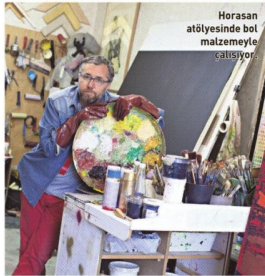
Horasan atölyesinde bir matzemeye katılıyor.

"Pi Artworks'teki 'Labirent' sergim devam ediyor. Onun haricinde bir de Çanakkale'de düzenlediğimiz 'Benimle Oynar mısın?' başlıklı Çocuk Bienali sürüyor."